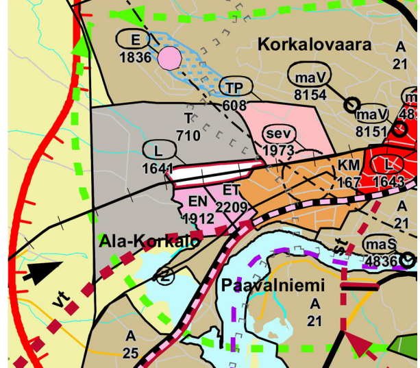
Kuva 3. Rovaniemen maakuntakaava

Alue kuuluu Rovaniemen ja Itä-Lapin maakuntakaava-alueeseen. Maakuntakaava on kuulutettu voimaan 21.9.2022. Suunnittelualue on maakuntakaavassa yhdyskuntateknisen huolon alue ET.