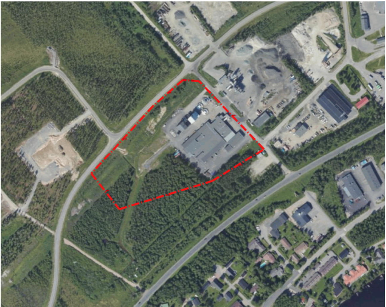
Kuva 1. Ortokuva, alustava suunnittelualue rajattu punaisella viivalla.