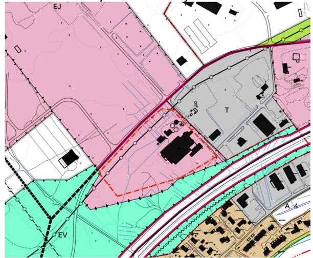
Kuva 4. Ote yleiskaavasta

Alueella on kaupunginvaltuuston 24.01.2011 hyväksymä yleiskaava. Suunnittelualue on yleiskaavassa osoitettu jätteenkäsittelyalueeksi EJ.